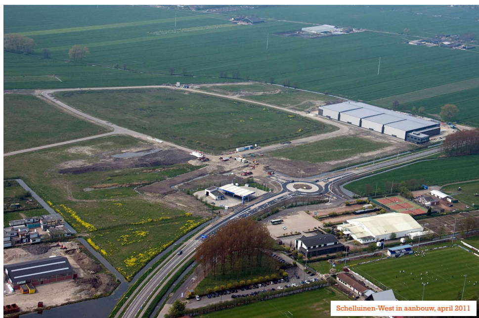
Schelluinen-West in aanbouw, april 2011

Op dit moment zijn parkeerlocaties beschikbaar in Groot Ammers, in Streefkerk en in Gorinchem. Daarnaast wordt voorjaar 2011 Truckpark 24/7 (Maatgroep) op bedrijventerrein Nieuwland te Alblasserdam geïntroduceerd als nieuwe locatie. Verder wordt nog gezocht naar een geschikte locatie in de oostflank van de regio en in Hardinxveld-Giessendam, hierbij wordt gedacht aan bedrijventerrein Meerkerk.